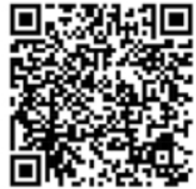
大台北公車動態 666華梵大學